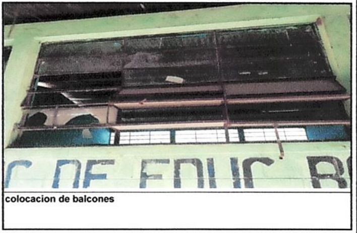
colocacion de balcones